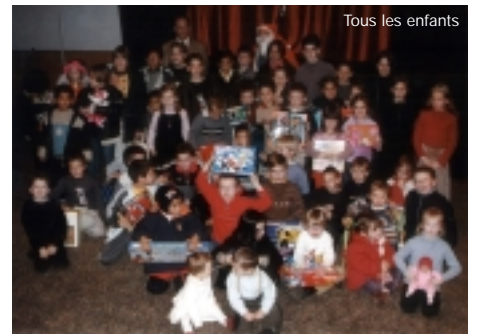
Tous les enfants

Après un spectacle de marionnettes fort apprécié de ce jeune public, si l'on en juge par la participation de celui-ci, Les enfants ont ensuite été invités à prendre un copieux goûter offert par notre ami J.L. Jourdain avant que le Père Noël n'apparaisse pour leur remettre à tous un cadeau offert par chacun d'entre nous.