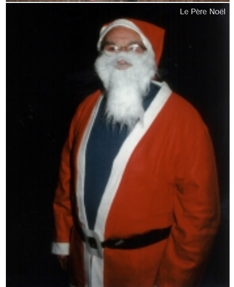
Le Père Noël