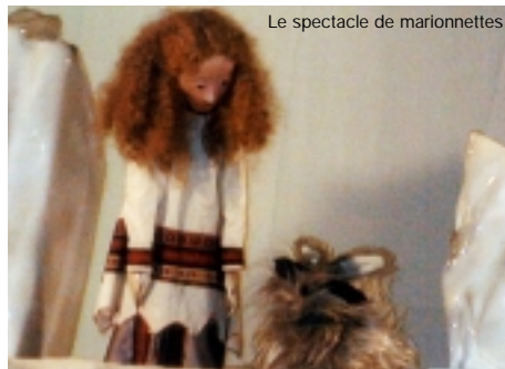
Le spectacle de marionnettes

Il nous a fait part de quelques remarques pertinentes concernant notamment la protection juridique et physique du club.