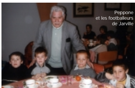
Peppone et les footballeurs de Jarville