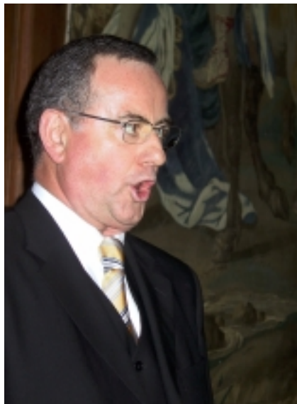
Quelques images de ce week end passé ensemble