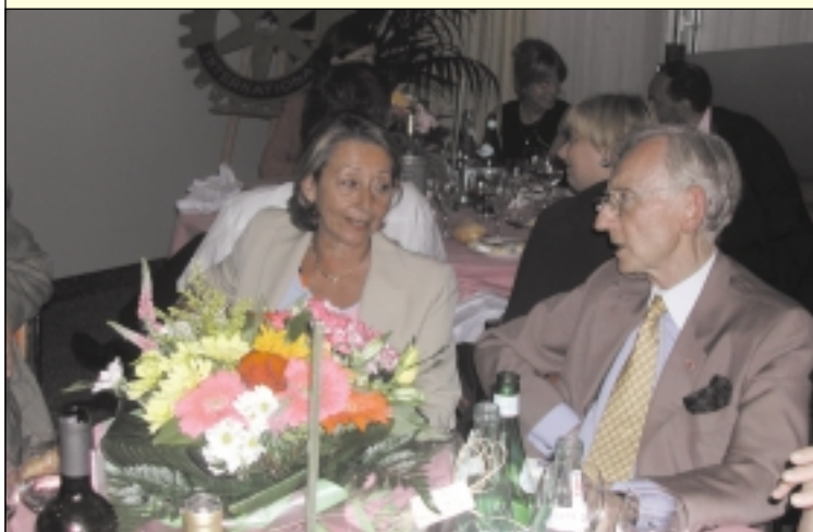
▲ Conversation autour d'un bouquet de fleurs