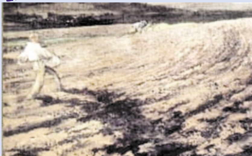
▲ Le Semeur de Bastien Lepage, l'un des chef d'oeuvres à découvrir.

T ous Rotariens et tous Lorrains : ce pourrait être le titre d'une pièce qui se jouera en trois actes. Objectif : participer à l'événement majeur de ce printemps, l'exposition "De la Lorraine".