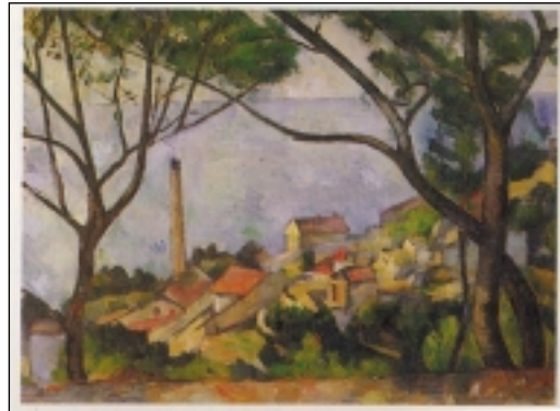
▲ Mer à l'Estaque : une oeuvre majeure de Cézanne