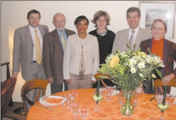
▲ Au rendez-vous du président, devant une table fleurie