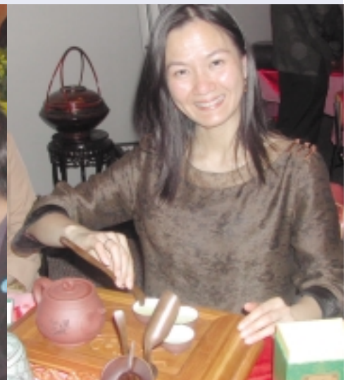
La cérémonie du thé : un rare et précieux moment