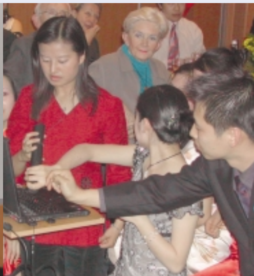
Autour de l'ordinateur pour des diaporamas très appréciés par les invités