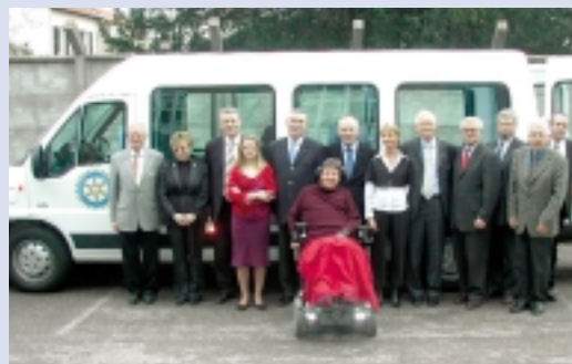
Le groupe des Rotariens, devant le véhicule livré à l'Association des Paralysés de France

Quelle belle action de nos Clubs nancéiens.