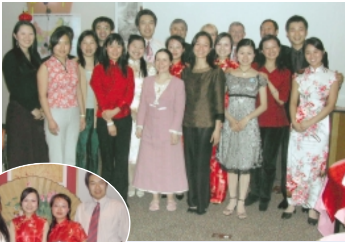
Le groupe des étudiants de l'Empire du Milieu, invités par le RC Nancy Stanislas : il y a actuellement à Nancy quelque 1000 étudiants chinois