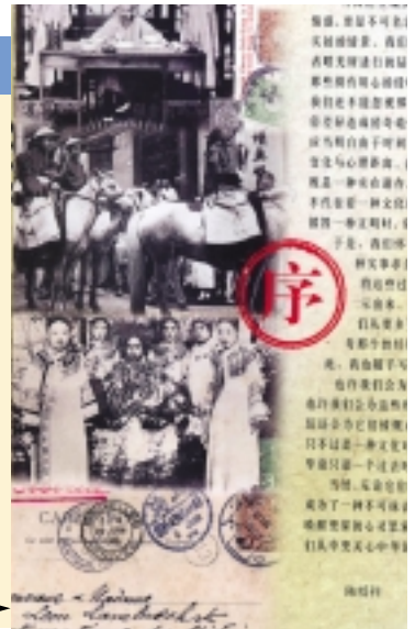
Reffet de la Chine au début du XX ème siècle : des cartes postales d'un autre temps

Rendez-vous le mardi 12 avril au soir. La tenue " muraille de Chine " n'est pas exigée.