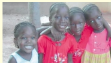
▲ Aide aux enfants de Sanankoroba, près de Bamako (lire en page 2)