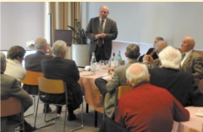
Un auditoire attentif