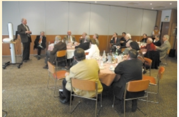
Attention et inquiétude