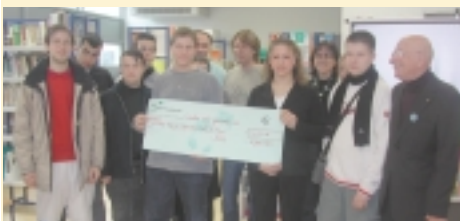
Le groupe des lycéens de Jean Prouvé et du CFA des métiers de l'automobile qui se sont mobilisés pour les "Badges du cœur".