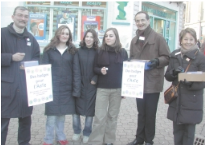
Au coude à coude, unis comme au club, pour l'opération de solidarité