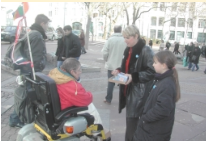
La solidarité ne connaît pas de frontières : le premier à acheter le badge du cœur, place Maginot, fut un handicapé.