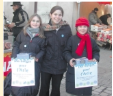
Les adolescentes, dimanche matin, étaient encore à l'oeuvre