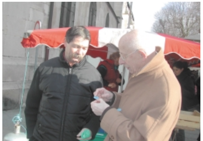
Le past-gouverneur Pierre Gaucher est venu prêter main forte