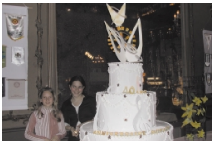
La pièce montée du 40 ème anniversaire