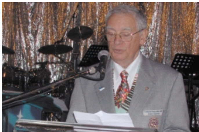
Le Gouverneur Bernard Kappaun au cours de son allocution