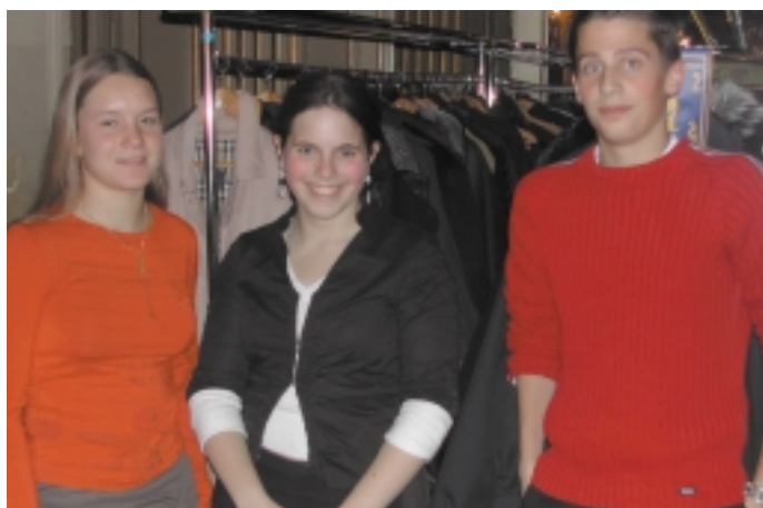
Les enfants de Rotariens ont apporté leur concours