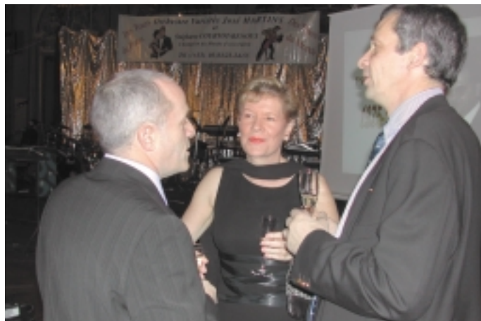
Discussion entre médecins