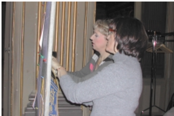
Les deux Michèle contrôlant les plans de tables