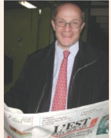
▲ Quoi de neuf docteur ?