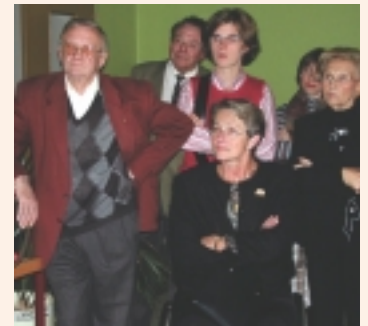
▲ Première étape au coin musée de L'Est Républicain.