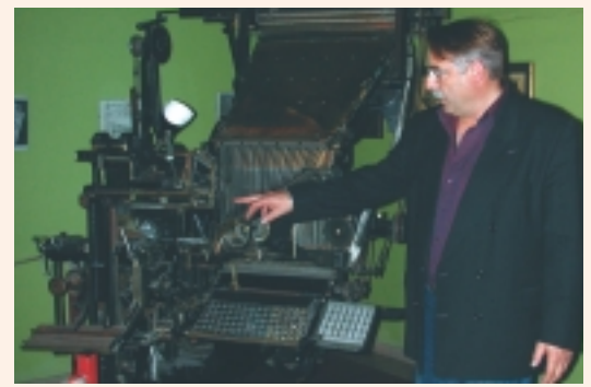
▲ Le linotype, témoin immuable de la grande époque du plomb.