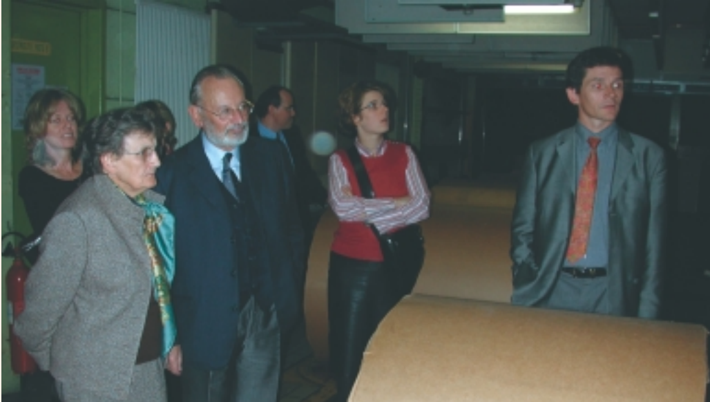
▲ Visite jusqu'au bout de la nuit, mais aussi au bout des rouleaux qui pèsent plus d'une tonne.

Pouvoir lire le jour même l'édition du lendemain : visiter un journal a toujours quelque chose de magique. Et d'impressionnant. Du reportage de journaliste jusqu'aux rotatives, la course contre la montre est quotidienne.