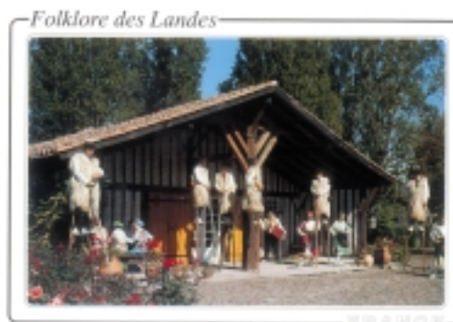
▲ Guy Combremont des Landes : "...Excellent séjour ici dans Les Landes..."