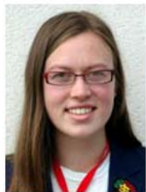
Else SCHLERMAN USA Longwy