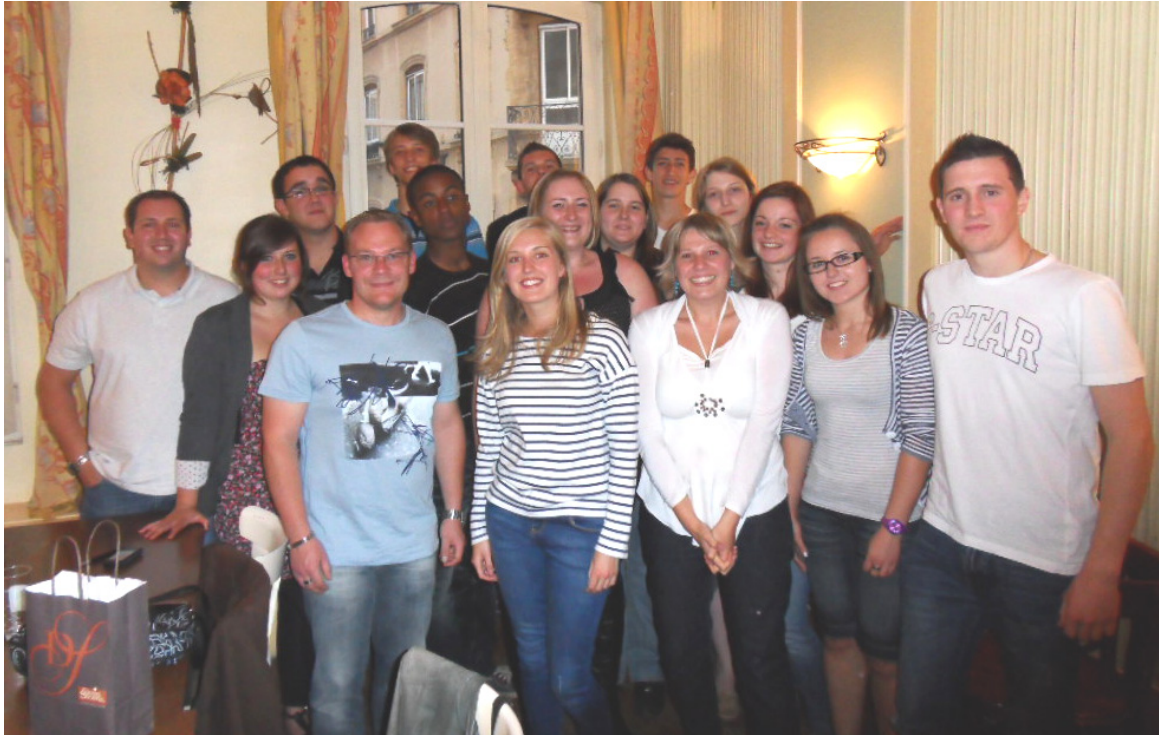
Photo des membres du Rotaract Club Thionville-Mirabelle